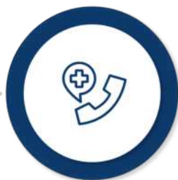
Ajutoarele de urgență (de la bugetul de stat și de la bugetul local)