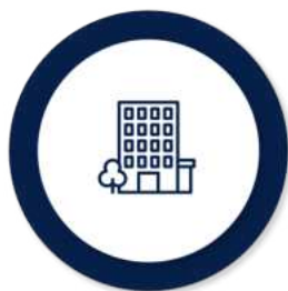
Asigurarea obligatorie pentru locuință

În funcție de nevoile familiei/persoanei singure, venitul minim de incluziune este însoțit de alte drepturi complementare, plătite de la bugetul de stat sau după caz, din bugetul local: