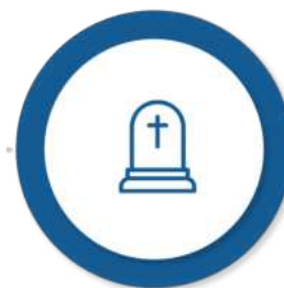
Ajutorul pentru înmormântare